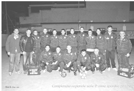
Campionato regionale serie D anno sportivo 2011/2012

Dopo sei mesi di calcio a 5 giocato, la serie D di futsal 2011/2012 chiude i battenti. Con essa anche i ragazzi di De Felice, ma senza alcun rimpianto, o quasi. Si perché l'unica squadra rappresentante del comune di San Felice a Cancellò in questo sport, è andata veramente vicina dal compiere un'impresa che ad inizio anno sembrava una chimera: raggiungere i play-off di serie C2. Ad inizio stagione il gruppo non era ancora stato definito e tante erano le incertezze che riguardavano il futuro